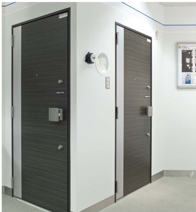
開力軽減プッシュプル錠 開力軽減効果体験エリア