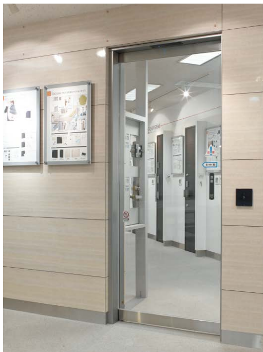
ハンズフリー入館 体験エリア